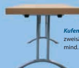
Kufen-Beschlag zweisäulig mind. Breite 60 cm